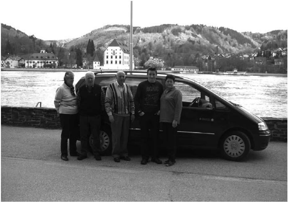
Warten auf die Fähre über die Donau